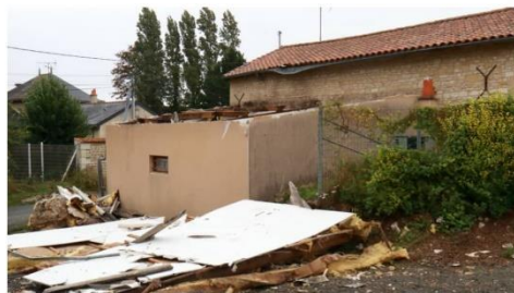
L'explosion a soufflé la toiture de la dépendance.

À Bournand dans le secteur de Loudun, la dépendance d'une habitation a été ravagée par une explosion suivie d'un incendie, dans la nuit du vendredi 4 au samedi 5 août 2023.