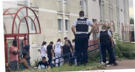
Le bébé est tombé du deuxième étage de la résidence Mozart, à la Plaine d'Ozon à Châtelleraut.

Publié le 08/08/2023 à 11:01 | Mis à jour le 08/08/2023 à 11:45