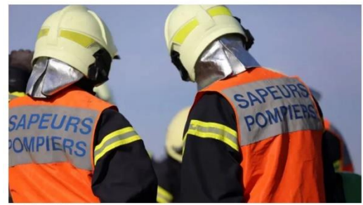
Les pompiers sont intervenus.

Publié le 10/08/2023 à 11:49 | Mis à jour le 10/08/2023 à 13:58 FAITS DIVERS JUSTICE - CHÂTELLELAUT