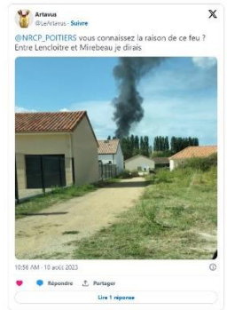
Les pompiers sont intervenus. L'occupant n'a pas été blessé. Selon les premiers éléments recueillis par la gendarmerie, le feu est d'origine accidentelle. Dans son logement décrit comme vétuste, l'occupant a branché un appareil électrique qui a pris feu.

Jeu 10 août 2023, en milieu de matinée, un mobil-home installé dans un jardin a pris feu au lieu-dit « La Reculée », à Doussay près de Lençloître. Une épaisse fumée noire était visible à plusieurs kilomètres à la ronde.