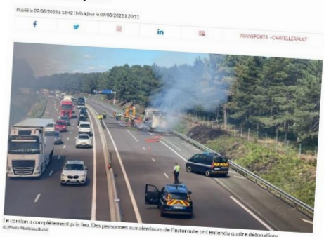
Le camion a complètement pris feu. Les personnes aux abords de l'autoroute ont entendu qu'il y avait des explosions.

Un camion a pris feu aux alentours de 15 h 30 ce mercredi 9 août 2023 sur l'autoroute A10 au niveau de Naintré dans le sens Bordeaux-Paris. Ce sens de la circulation a été bloqué avant d'être partiellement rouvert.