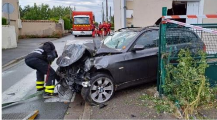
Le choc a été très violent.

La voiture remontait la rue du Planty dans une zone où la vitesse est limitée à 50 km/h quand elle a subitement dévié sa trajectoire vers la droite, tapant un panneau de signalisation et défonçant la clôture avant de taper violemment le mur. Après avoir éventré la maison, l'auto s'est retrouvée, à la faveur d'un rebond, à la perpendiculaire de l'habitation.