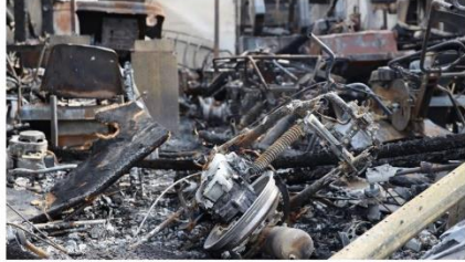
Dans les débris de Couhé Motoculture.