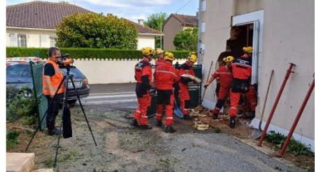
L'équipe de sauvetage déblaiement des pompiers a posé des étais pour consolider le mur.

Les deux jeunes, choqués mais pas blessés, ont été conduits au CHU de Poitiers pour y subir des examens de contrôle. Parmi la douzaine de pompiers dépêchés sur place, une équipe de sauvetage déblaiement a consolidé le mur avec des étais.