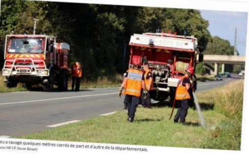
Le feu a ravagé quelques mètres carrés de part et d'autre de la départementale.

Les pompiers sont intervenus entre Coulombiers et Fontaine-le-Comte, jeudi 10 août 2023, à 17 h 30, pour éteindre plusieurs départs de feux au bord de la D611.