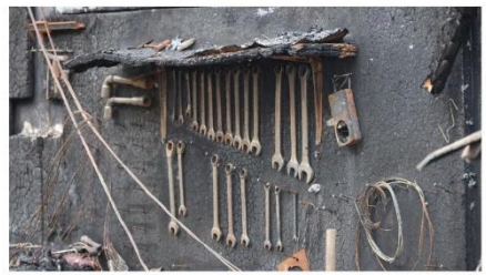
Sagement aligné au-dessus de ce qui il reste d'un établi, un jeu de clés plates, seules rescapées du sinistre.

La destruction totale de l'enseigne Couhé Motoculture, le 3 août 2023, a de lourdes conséquences pour le couple de propriétaires et leurs clients, dont certains sont aussi victimes.