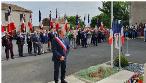
Une quinzaine de porte-drapeaux étaient présents pour cette cérémonie.

Facebook | Twitter | LinkedIn | YouTube | RSS | COMMÉMORATION - MILLAC