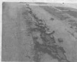
Les réseaux d'évacuation n'ont pas supporté le flux.

C'est un « épisode d'intempéries hyperlocalisé », selon les pompiers, qui a touché Civray mardi 6 juin, entre 17 h 30 et 18 h. Les pluies intenses mêlées de grêle ont provoqué quelques dégâts. La supérette de la place du Maréchal-Leclerc a été inondée avec 2 cm d'eau dans les locaux. Les faux plafonds ont été imbibés d'eau sur 100 m 2 . Un employé a été mis au chômage technique le temps de la remise en état de la Coop fermée mercredi. Une habitation a aussi été touchée ainsi que 40 m 2 d'un garage. La commune fait aussi état de dégâts causés à la voirie par l'afflux massif d'eau dans le réseau. Le goudron a été soulevé et une rue fermée à la circulation. Plusieurs entreprises et des bâtiments communaux ont été touchés par des infiltrations venues des fenêtres de toit.