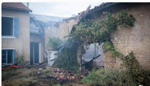
L'incendie est parti d'une grange, avant de se propager aux maisons mitoyennes

Les pompiers de la Vienne ont été appelés ce mercredi en fin d'après-midi pour l'incendie d'une grange dans le bourg de Chabournay. Le feu s'est propagé à deux maisons mitoyennes.