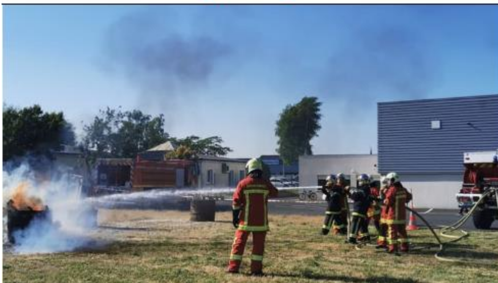
Tout au long de la journée, les ateliers ont permis de s'initier au métier de pompiers.

Une première dans la Vienne. Samedi 3 juin, seize volontaires ont revêtu la tenue de pompiers, encadrés par une quinzaine de pompiers du centre de secours et incendie de Loudun.