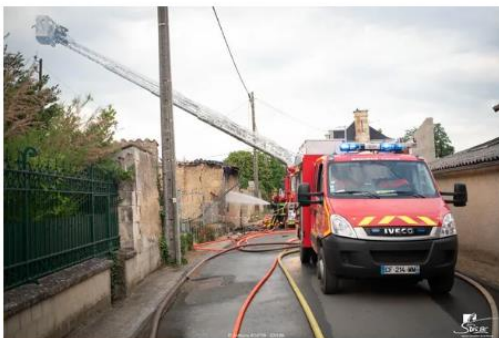
Vingt-cinq pompiers ont été mobilisés sur cet incendie

Huit personnes ont dû être évacuées. Deux ont été transportées à l'hôpital. Une femme suite à l'inhalation de fumée et puis un homme légèrement brûlé à un bras et à une jambe.