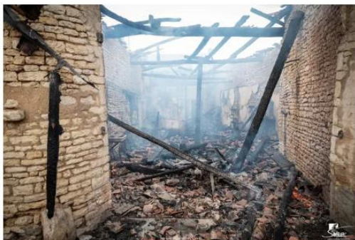
La grange est entièrement détruite - Sdis 86

L'intervention de 25 sapeurs-pompiers, aidés de trois lances, a permis de limiter la propagation des flammes. La première maison a juste été envahie par les fumées. En revanche, la seconde est endommagée à 50 %, précise les pompiers. La grange est entièrement détruite.