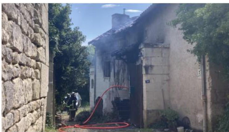
Le feu a pris à l'étage. La maison est entièrement détruite.

Une maison a été détruite par un incendie, jeudi 8 juin 2023, au lieu-dit « Les Blots » à Thuré, près de Châtelleraut. Il n'y a eu aucun blessé.