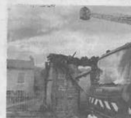
La grange a été ravagée et deux habitations touchées.

avoir inhalé des fumées et un homme a été brûlé légèrement à un bras et à une jambe. Les six autres personnes examinées sont indemnes. Le maire de la commune est présent sur les lieux ainsi que la gendarmerie. L'électricité a dû être coupée afin de permettre aux opérations de secours de se poursuivre. Trente-sept habitations sont touchées par cette coupure de courant.