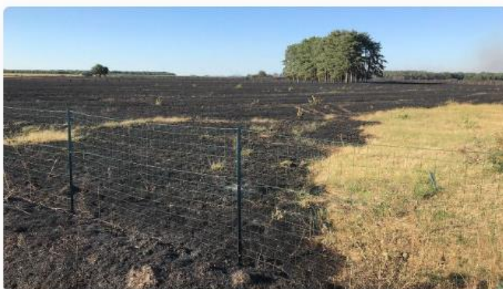
Les opérations de pédagogie des pompiers auprès des usagers ont permis de limiter les départs de feu. (Image d'illustration)