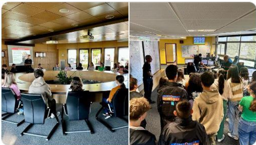
Département Vienne et 2 autres personnes