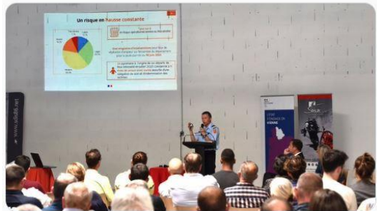
Préfet de la Vienne et 3 autres personnes