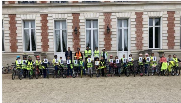
Les petits cyclistes de l'école Camille-Desmoulins de Vouneuil-sous-Biard ont été sensibilisés à la sécurité routière.

Une classe de CM2 de Vouneuil-sous-Biard est venue ce lundi 15 mai à vélo jusqu'à la préfecture pour une sensibilisation ludique à la sécurité routière.