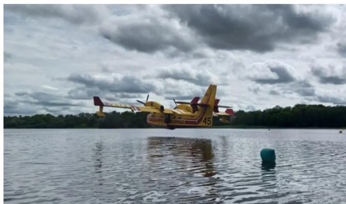
Des pompiers de la Vienne se sont formés pour guider le largage d'eau d'un Canadair.

Formation des pompiers, sensibilisation des élus, des agriculteurs, des professionnels... la Vienne se met en ordre de marche contre le risque de feux de forêt, en ce printemps 2023.