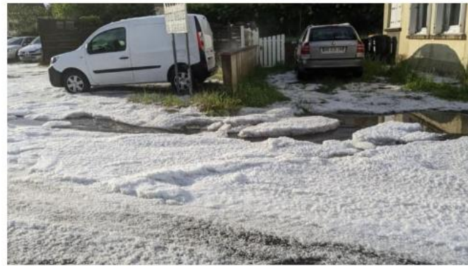
La grêle a recouvert les routes et les paysages d'un manteau blanc.

Les sapeurs pompiers de la Vienne ont réalisé une dizaine d'interventions ce samedi 6 mai 2023.