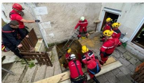
Les équipes du SDIS 86 en pleine intervention à Montmorillon, ce mercredi 10 mai.

Ce mercredi 10 mai, à Montmorillon, un homme de 80 ans s'est retrouvé coincé sous sa propre terrasse. Le carrelage de jardin s'est affaissé à son passage et c'est son fils qui l'a découvert, prévenant les secours vers 7h45.