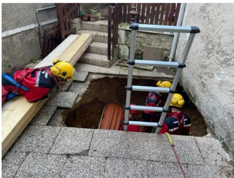
La victime a été transportée au CHU de Montmorillon (86) en hypothermie sévère.

Les pompiers ont été appelés un peu avant huit heures ce mercredi matin dans une maison de la Cité du Livre à Montmorillon, dans la Vienne. Selon les premières constatations, un homme était tombé dans une cavité qui venait de se creuser sur sa terrasse. Il pourrait s'agir d'une fuite ou d'une infiltration d'eau qui aurait provoqué l'affaissement du sol.