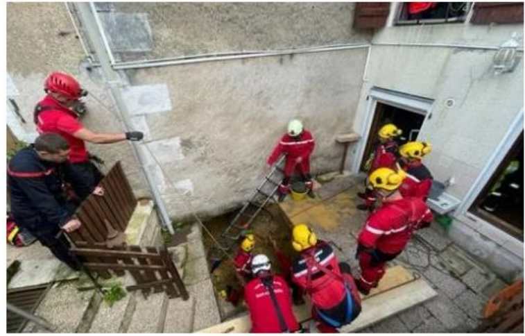
Ce mercredi à Montmorillon, un homme de 81 ans a fait une chute de 3 mètres après l'effondrement de sa terrasse. —

ACCIDENT Ce mercredi, un homme de 81 ans a dû être extrait d'une cavité de trois mètres après l'effondrement de sa terrasse Nello Da Silva | Publié le 11/05/23 à 09h46