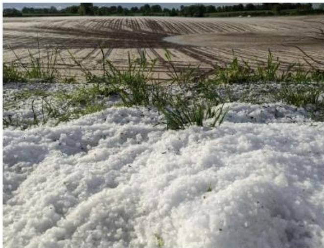
Un orage de grêle s'est abattu sur Rouillé.