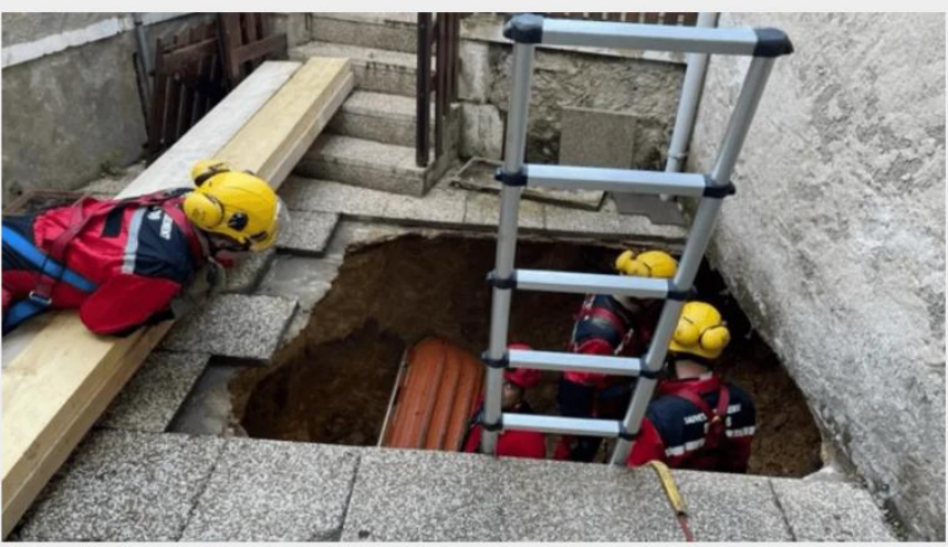
L'intervention des sapeurs-pompiers aura duré trois heures.

Ce mercredi matin, les sapeurs-pompiers de la Vienne sont intervenus à Montmorillon pour porter secours à une personne tombée dans une cavité provoquée par l'effondrement de sa terrasse.