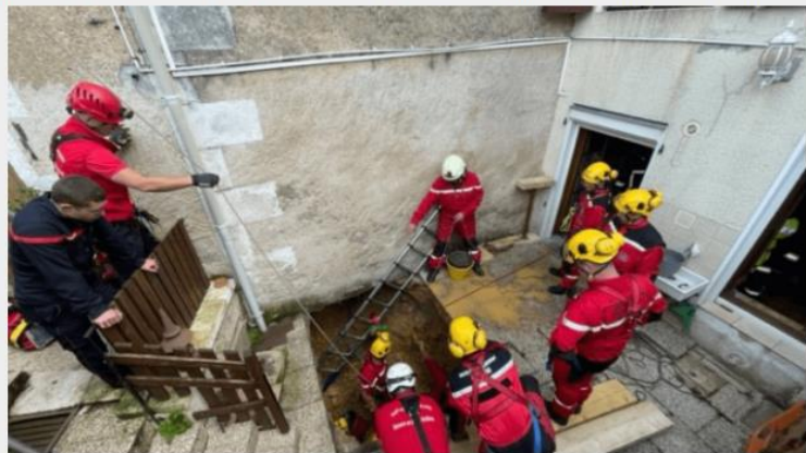
L'intervention a duré plus de trois heures. La victime, souffrant d'une hypothermie sévère, a été évacuée vers le centre hospitalier de Montmorillon. Les circonstances de l'affaissement restent pour l'instant inconnues.

25 sapeurs-pompiers et 9 engins sont intervenus en tout début de matinée, ce mercredi 11 mai, dans le sud-Vienne, à Montmorillon, pour une intervention inhabituelle : une personne est tombée dans un trou sur sa terrasse.