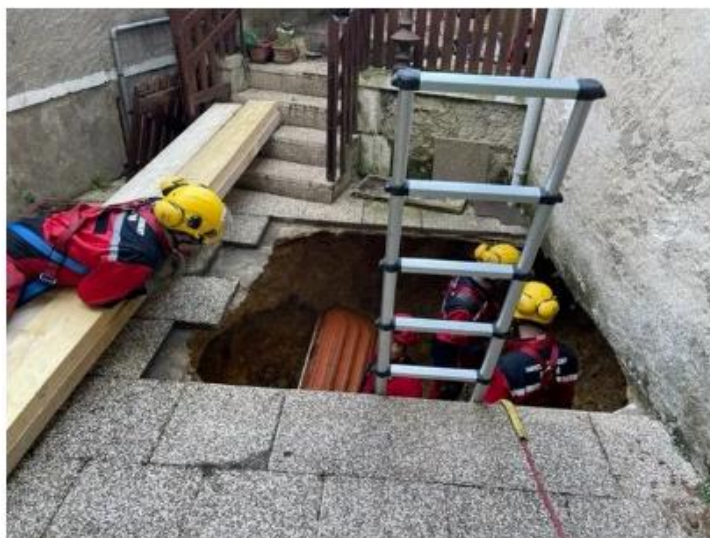
Intervention des pompiers de la Vienne, après la chute d'un habitant de Montmorillon, sous sa terrasse ce mercredi 10 mai.

La victime était tombée quelques heures plus tôt dans une cavité de trois mètres de profondeur, probablement formée suite à une infiltration d'eau. D'importants moyens de secours (9 véhicules et 25 sapeurs-pompiers) ont été déployés pour cette opération périlleuse. La victime a été transportée à l'hôpital de Montmorillon.