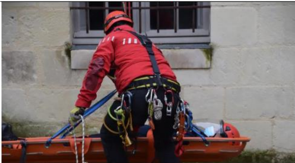
Les pompiers participent à des exercices.

Le centre d'incendie et de secours de Loudun propose à la population locale une journée d'immersion le 3 juin à partir de 9 h. On peut s'inscrire jusqu'au 15 mai inclus.