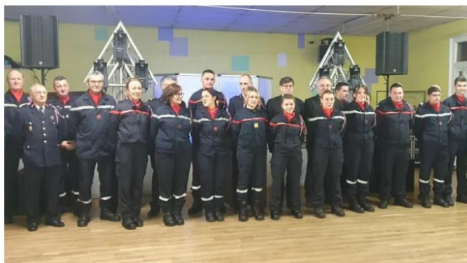
Le centre d'incendie et de secours a pu à nouveau célébrer la Sainte-Barbe, après deux années d'interruption.

Remise de médailles, promotion et bilan des interventions de l'année ont ponctué la Sainte-Barbe du centre d'incendie et de secours d'Availles-Limouzine samedi 21 janvier.