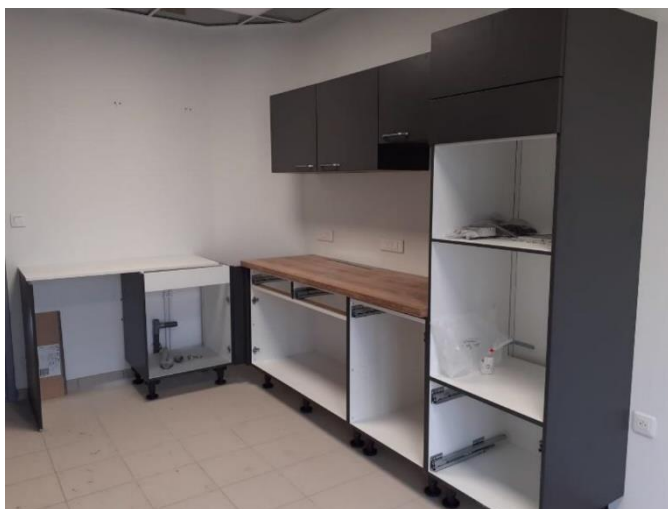
À gauche : aperçu de la salle polyvalente / À droite : aperçu du coin cuisine.