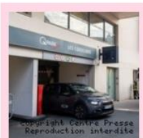
Les pompiers de la Vienne en intervention au parking des Cordeliers de Poitiers suite à un incendie le 12 décembre 2022.

L'important dégagement de fumée a nécessité de nombreuses reconnaissances dans les bâtiments. Certains habitants ont dû être évacués.