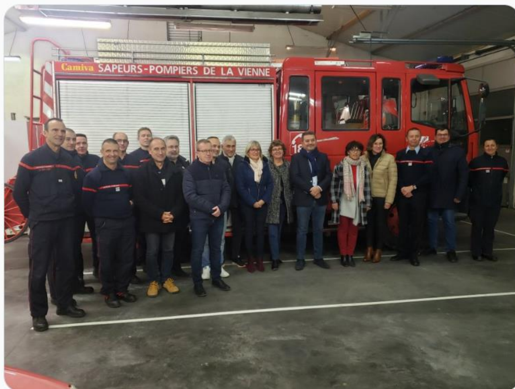
Département Vienne et 3 autres personnes