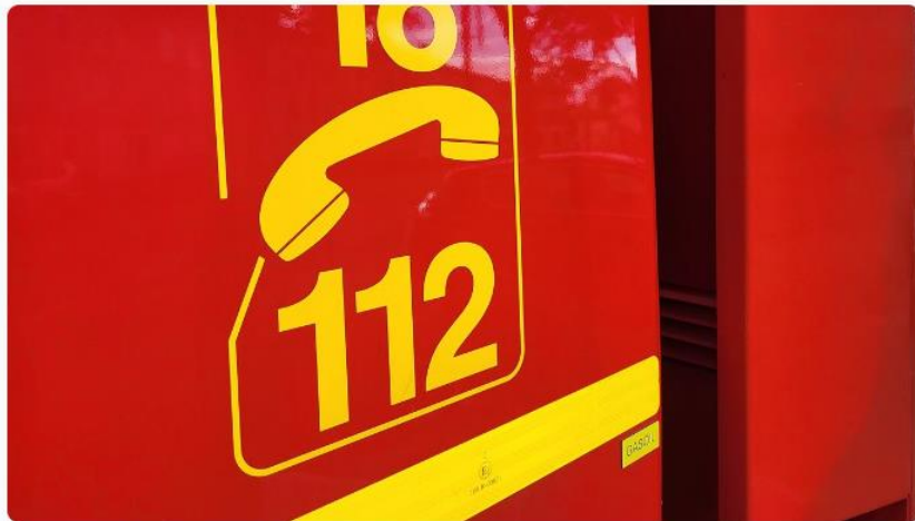
Illustration sapeurs-pompiers © Radio France - Arthur Blanc

Un feu de parking souterrain s'est déclaré au 18 allée des jardinières à Poitiers un peu avant 4 heures, ce mercredi 7 décembre. Deux voitures, un scooter, une moto et un conteneur ont pris feu. 80 appartements ont été évacués, indiquent les pompiers de la Vienne. L'intervention était toujours en cours ce mercredi matin vers 8h.