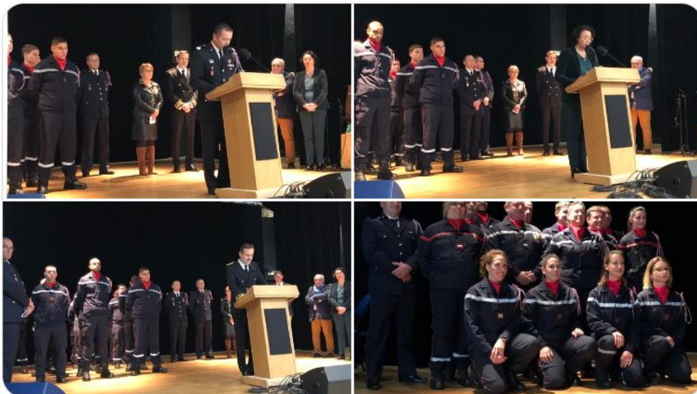
Préfet de la Vienne et 3 autres personnes

Samedi 03 décembre a été célébrée la Sainte-Barbe de L'Isle-Jourdain, en présence de la maire de la ville, des élus du secteur, du sous-préfet de #Montmorillon, du représentant de la gendarmerie ainsi que du directeur départemental du #SDIS de la #Vienne86 et chef de corps.