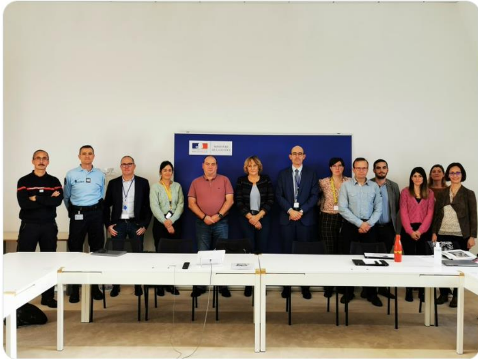
Ministère de l'Intérieur et des Outre-mer et 4 autres personnes

Le mercredi 9 novembre, une vingtaine de membres du parquet de Poitiers a bénéficié d'une formation sur l'outil de dénombrement des victimes SINUS. Le référent national de la #DGSCGC était présent à cette occasion, ainsi que le #SDIS de la #Vienne86 et la #gendarmerie nationale.