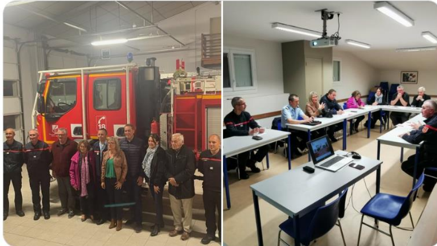
Préfet de la Vienne et 2 autres personnes