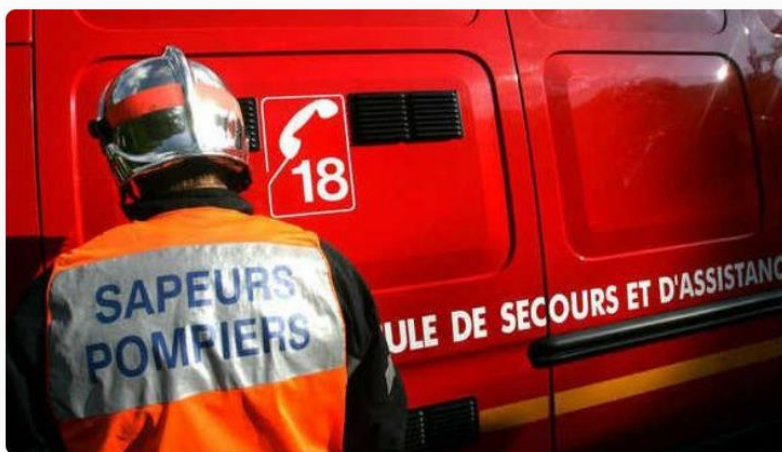
Des sapeurs-pompiers en intervention / Image d'illustration

Une voiture a fait un tonneau cette nuit sur la départementale D5, à hauteur de Saint-Pierre-de-Maillé. Quatre jeunes étaient à bord, deux garçons et deux filles âgés de 17 et 18 ans. Ils ont été légèrement blessés et ont été transportés par les pompiers au CHU de Poitiers. Vingt sapeurs-pompiers du SDIS 86 sont intervenus, à bord de cinq véhicules partis de Pleumartin, Saint-Savin, Saint-Pierre-de-Maillé, Tournons-Saint-Martin et Yzeures-sur-Creuse.