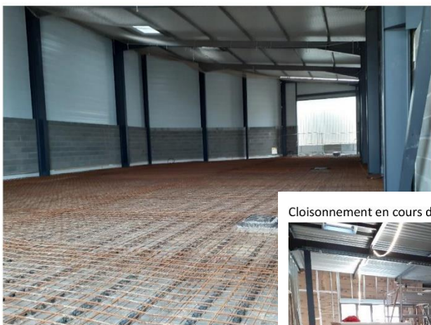
Cloisonnement en cours de la zone administrative

Ferrailage de la remise, coulage prévu le 2/11/22