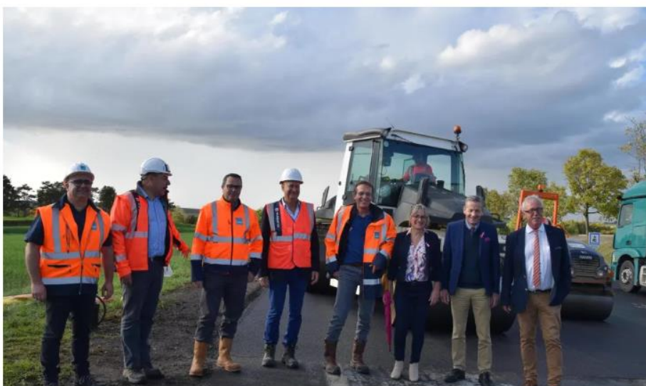
Les élus et les responsables des travaux.