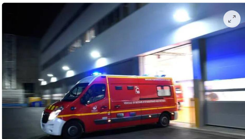
Une vingtaine de sapeurs-pompiers ont été dépêchés sur les lieux de l'accident.

Dans la soirée du samedi 22 octobre 2022, vers 21 h 30, un homme de 84 ans a pris l'autoroute A10 à contresens , au sud de Sainte-Maure-de-Touraine en Indre-et-Loire ( Centre-Val de Loire ), en direction de Paris , rapportent Centre Presse et Le Parisien , causant un accident qui a fait un mort et trois blessés.