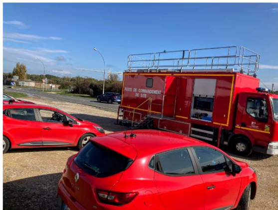
L'exercice se déroulait essentiellement à la cellule de crise de la préfecture, sauf ce PC mobile des pompiers déployé près du site classé Seveso.

La salle de l'Agora était transformée en centre d'accueil géré par la Croix Rouge. La circulation des trains et des bus avait été stoppée dans le secteur.