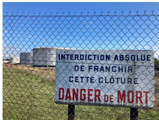
Le site sert de stockage pour des réserves stratégiques de carburant de l'Etat.

"J'ai pas ça ! Je ne suis pas allé à la réunion. Ils ont construit ça il y a soixante ans et j'habite là depuis cinquante ans, j'ai jamais eu de problème, alors, c'est pas la peine de se déplacer! Y a jamais de camion, c'est très rare. Autrefois, ils chargeaient ici, c'était des camions de La Rochelle, je ne vois même plus les trains. C'est la première fois qu'il y a un exercice (1). Les consignes en cas de problème, non je ne les connais pas ! C'est pas embêtant, on verra bien..."